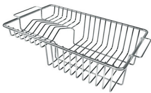
Cesta portaplatos inox 8100 201