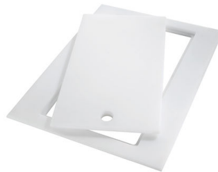
Tabla de corte Twin in HDPE 8644 101