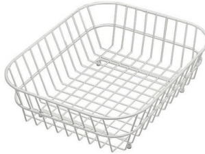
Cesta blanca de acero inoxidable 8612 000