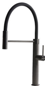
Monomando Skin Gun Metal 8424 856